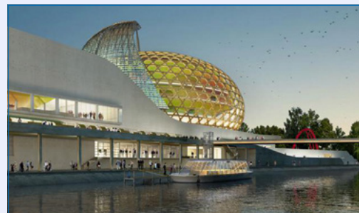
La Seine Musicale à Boulogne Billancourt (92)